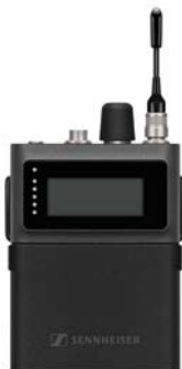
SPECTERA SEK (1G4)

Die bidirektionalen SEK-Bodypacks sind gleichzeitig IEM-/IFB-Empfänger und Mikrofon-/Line-Sender. Über dieselbe HF-Verbindung lassen sich die Geräte über die WebUI vollständig fernsteuern und -überwachen, zum Beispiel IEM-Lautstärke, Audiopegel, Audioeinstellungen, HF-Kanalqualität, Ladezustand usw. Es sind Versionen für UHF (470 – 608 MHz und 630 – 698 MHz) sowie 1G4 (1350 – 1400 MHz und 1435 – 1525 MHz) erhältlich.