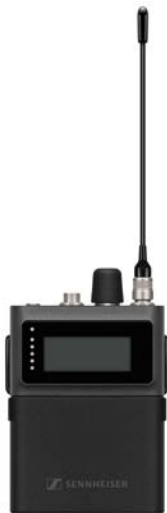
SPECTERA SEK (UHF)