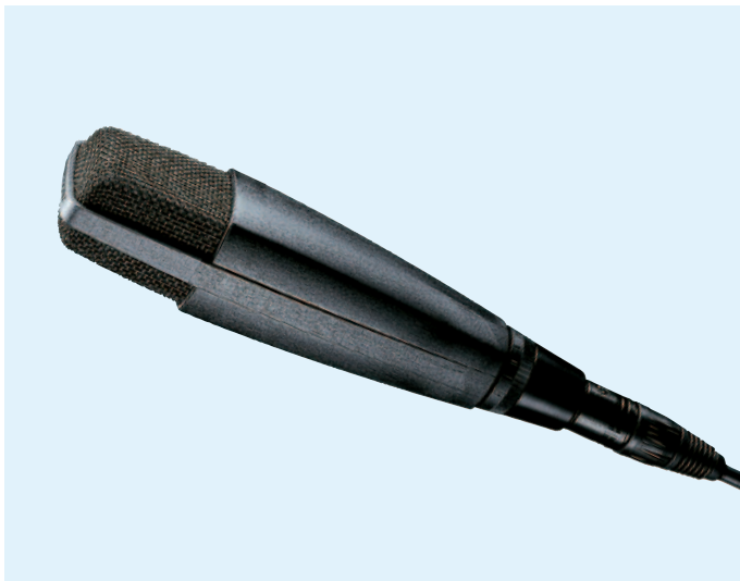
Das abgebildete Kabel gehört nicht zum Lieferumfang.

Das MD 421 II gehört zu den bekanntesten Mikrofonen der Welt. Durch seine klanglichen Qualitäten ist es in den vielfältigsten Aufnahmesituation und in allen Bereichen der Tonübertragungstechnik einsetzbar. Der 5-stufige Baßschalter unterstreicht seine Allround-Qualitäten. Farbe: schwarz.