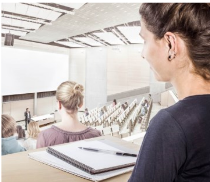
MobileConnect setzt auf bestehende Netzwerktechnologien und einen ‚Bring your own Device‘-Ansatz.

Zusätzlich zur akademischen Welt lässt sich MobileConnect auch in den Bereichen Digital Signage, allgemeine Hörunterstützung, Audiodeskription und sogar zur Simultanübersetzung einsetzen. Die praktisch grenzenlosen Anwendungsgebiete umfassen unter anderem Theater, Kirchen und Konferenz-Zentren.