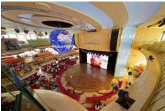
Inklusion an Bord, auch im Theatrum, mit Sennheiser MobileConnect.

Früher waren in den Entertainment-Areas von Kreuzfahrtschiffen meist besonders ausgewiesene Sitzplätze für Menschen mit eingeschränkter Hörfähigkeit reserviert; Audiosignale wurden über im Boden verlegte Induktionsschleifen übertragen. Bei modernen Schiffen wie AIDAprima werden hingegen auf Anforderung Taschenempfänger mit daran befestigten Induktionsschlingen ausgegeben, so dass eine freie Sitzplatzwahl möglich ist.