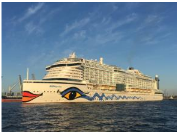
Auf dem neuesten Schiff der AIDA-Flotte, der AIDAprima, stellen Sound-Lösungen von Sennheiser ihre Leistungsfähigkeit täglich unter Beweis.

Wedemark/Rostock, 13. März 2017 – Auf dem neuesten Schiff der AIDA-Flotte stellen Sound-Lösungen von Sennheiser ihre Leistungsfähigkeit täglich unter Beweis. Premiumprodukte des Audiospezialisten liefern auf einem der weltweit modernsten Kreuzfahrtschiffe die Infrastruktur für hochwertiges Entertainment. Neben anerkannt zuverlässiger Sennheiser Drahtlostechnik kommt auf AIDAprima die innovative MobileConnect Streaming-Lösung zum Einsatz, die sich dank des neuesten Updates auch in bestehende Netzwerke integrieren lässt. AIDAprima schlägt ein neues Kapitel der Kreuzfahrtgeschichte auf - Sennheisers „Shape the Future of Audio“-Versprechen passt perfekt dazu.