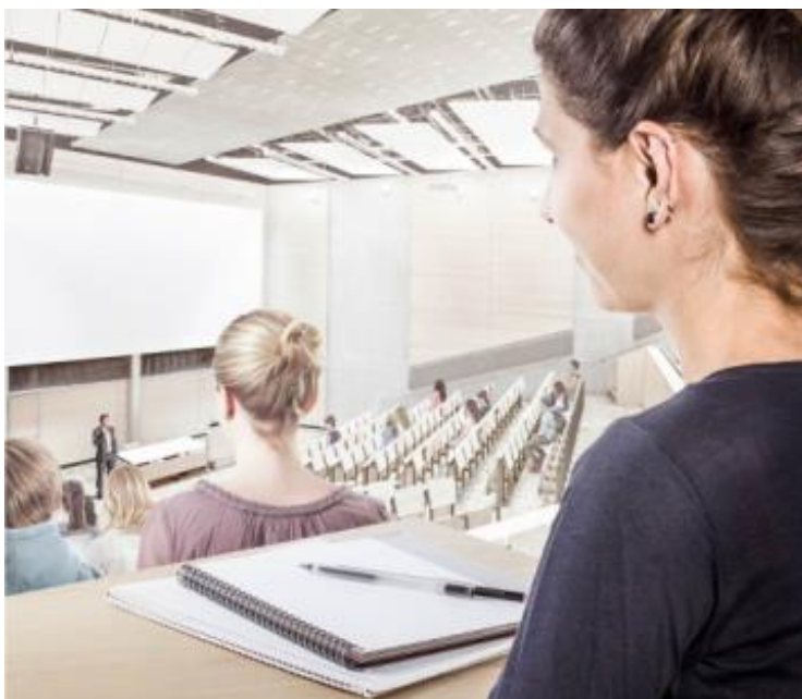
MobileConnect setzt auf bestehende Netzwerktechnologien und einen ‚Bring your own Device‘-Ansatz.

Zusätzlich zur akademischen Welt lässt sich MobileConnect auch in den Bereichen Digital Signage, allgemeine Hörunterstützung, Audiodeskription und sogar zur Simultanübersetzung einsetzen. Die praktisch grenzenlosen Anwendungsgebiete umfassen unter anderem Theater, Kirchen und Konferenz-Zentren.