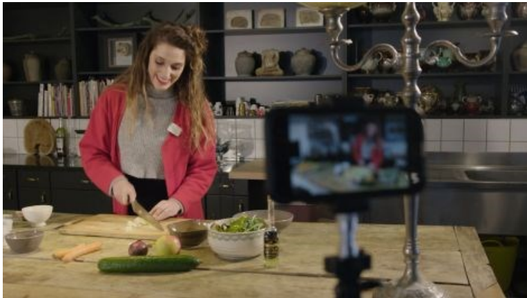
Exzellenter Sound für deinen Content mit dem drahtlosen Sennheiser Memory Mic